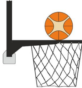
Figure 2 : Ballon en contact avec l'anneau

Il y a intervention illégale par un joueur défenseur ou attaquant si, lors d'un tir au panier, un joueur touche le panier ou le panneau alors que le ballon est en contact avec l'anneau et qu'il a encore la possibilité de rentrer dans le panier.