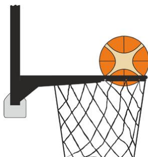
Figure 3 : Ballon dans le panier

Il y a violation pour intervention illégale si un joueur défenseur touche le ballon quand il est dans le panier.